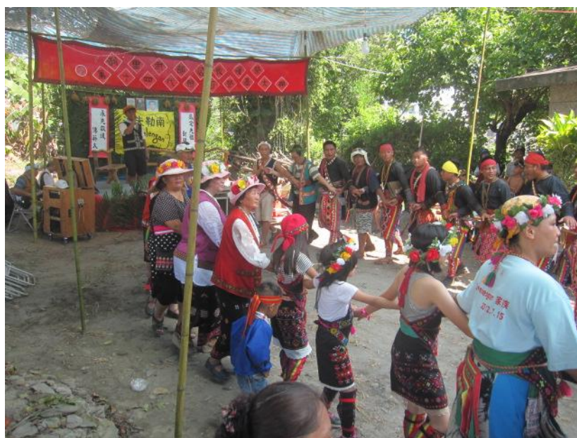
利里武部落小米收穫祭