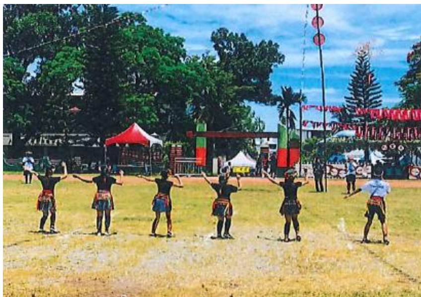
圖為聯合收穫祭照片