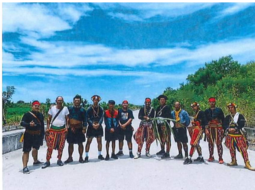
圖為利里武部落最南邊的祭祀點，部落族人合照