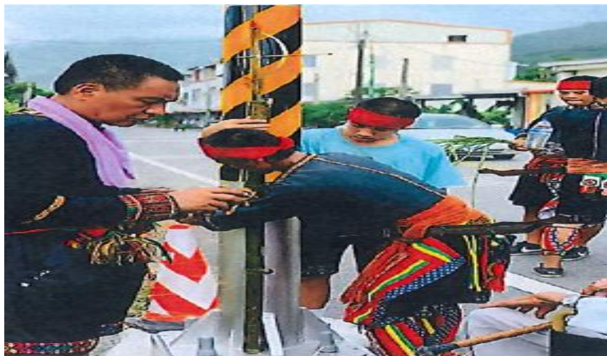
六處入口立下祭壇和設置弓箭