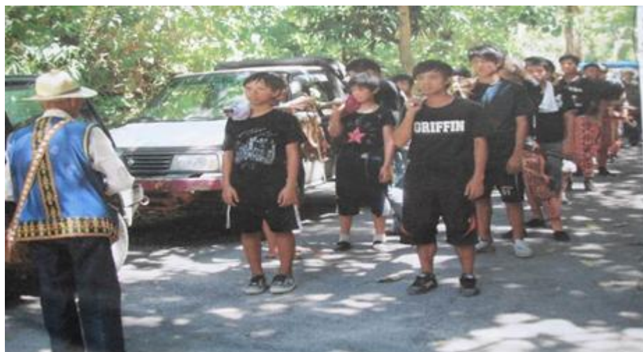
獵人歸來祭司在 cacavan 地行「pacaci' er、paitjala' 」阻隔祭儀