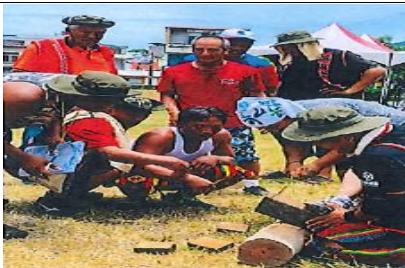
圖為聯合收穫祭照片